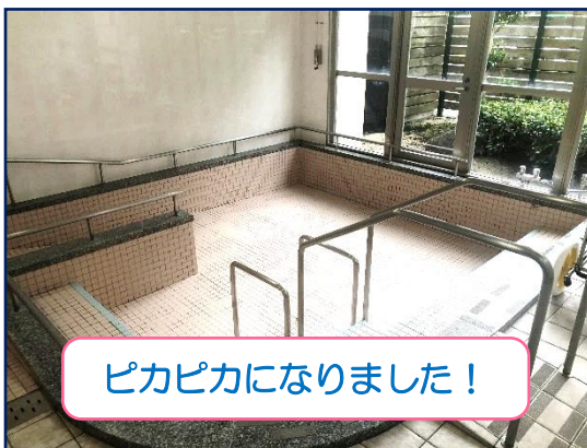
ピカピカになりました！

現在「お迎え」時に検温を実施しております。検温時に体温が 37.5℃以上 の時は、サービスの利用を控えさせて頂きます。ご利用者様については、病院受診して頂き、診察結果をご連絡下さい。感染予防のためご理解とご協力をお願い致します。