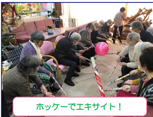
ホッケーでエキサイト！