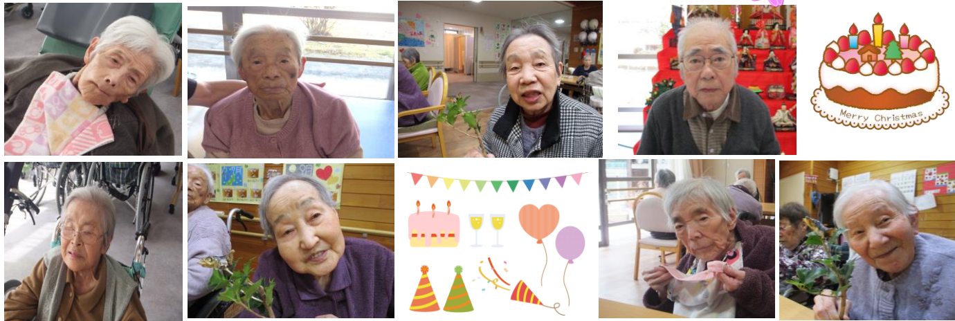
※お写真のみの掲載とさせていただきます